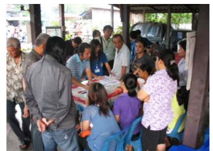
รูปที่ 6 ขั้นตอนการทำงานและการมีส่วนร่วมของประชาชนในการวางแผนปรับปรุงชุมชนพุทธมณฑลสายสอง