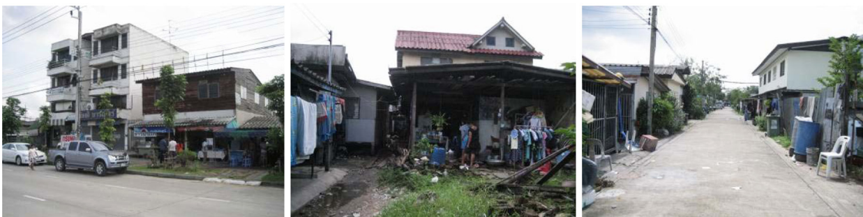
รูปที่ 5 สภาพกายภาพทั่วไปภายในชุมชนพุทธมณฑลสายสองบนที่ดินสำนักงานทรัพย์สินส่วนพระมหากษัตริย์